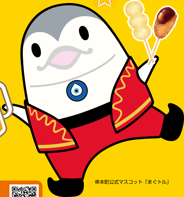
串本町公式マスコット「まくトル」